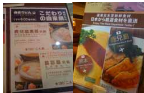
「鹿児島」が表示された看板やメニュー