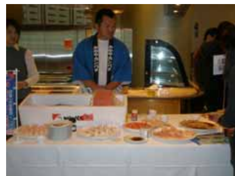
県漁連試食商談会