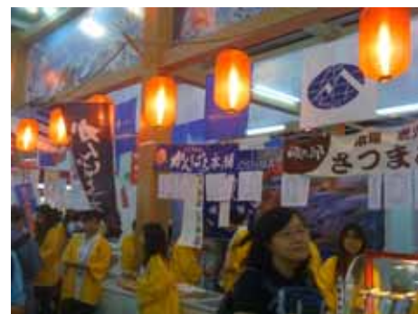
FOOD EXPO 2009