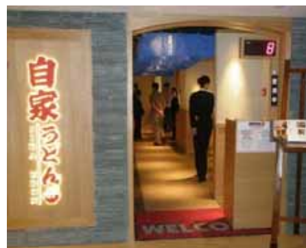
お昼時には行列ができる自家うどん