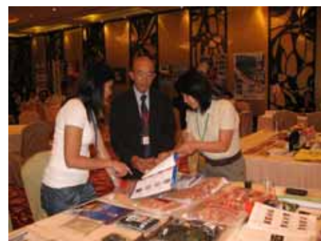
鹿児島・香港貿易商談会