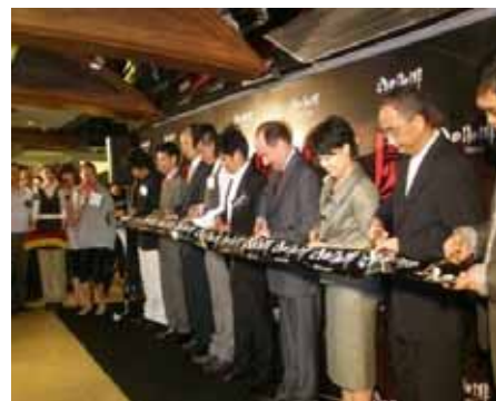
レストランの開店式典

同氏は、今後香港ではまだなじみのない豚カツレストランをオープンさせる計画を持っている。計画がうまく進み「かごしま黒豚」専門のトンカツ屋で、野菜からデザートまであらゆる食材が鹿児島の食材で提供される日が来るかもしれない。