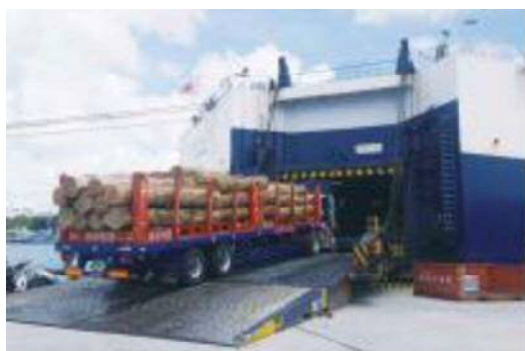
みやらびIIへ積み込まれるトレーラー