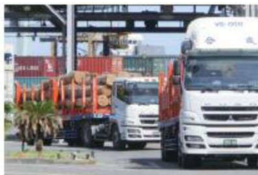
①丸太を積載したトレーラー(高雄港内)

台湾国内に船会社琉球海運が提供するトレーラーが乗り入れることで、日本での貨物の集荷から台湾での納入までを同一トレーラーで一貫して行える「シームレス物流」が可能。