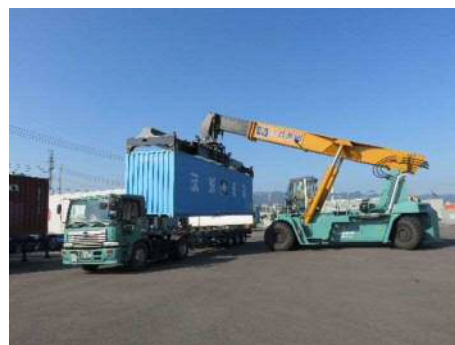
【鹿児島港国際コンテナヤードでの荷役風景】

【お問い合わせ先】 (株)共進組 TEL 099-203-0022 鹿児島県鹿児島市谷山港1丁目2-4