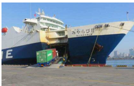
【ランプウェイ荷役 (船内へシャーシで船積み)】