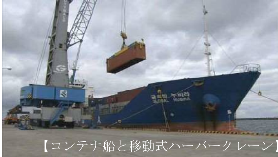
【コンテナ船と移動式ハーバークレーン】