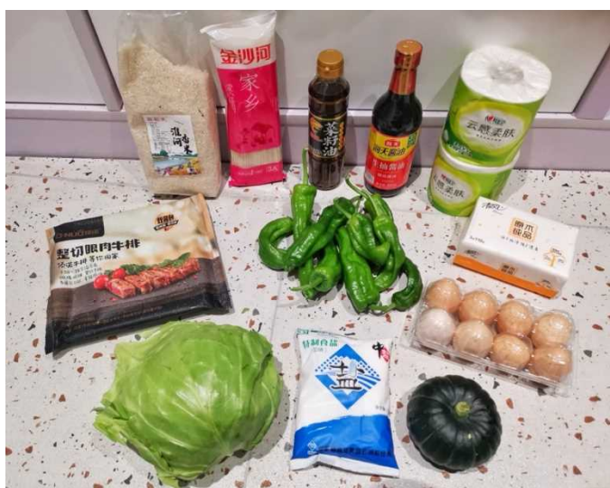
政府からの配給品 ↑