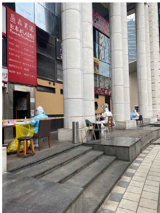
↑ 居住マンションに設置された臨時 PCR 検査場

湾まで運ぶことが出来ない、または輸入しても貨物を港湾から運び出せないという事態が発生しているようです。既に輸入して上海市内の倉庫に納入している商品についても、上海市内の日本産酒類の代理店にヒアリングしたところ、上海市内の飲食店等は営業停止しており注文はなく、上海市外の地域から発注があっても上海市内の倉庫から商品運び出すことが出来ず、業務ができないというような状況でした。税関総署の統計によると、税関別の貿易額では、上海市を管轄する上海税関の貿易額は2021年に7兆5,743億元と、中国全体の19.4%を占めており、中国の輸出入の窓口の役割を担っている上海市の封鎖措置の影響は大きく、早期の収束、経済活動の復旧が望まれます。