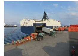
【鹿児島港国際コンテナヤードでの荷役風景】