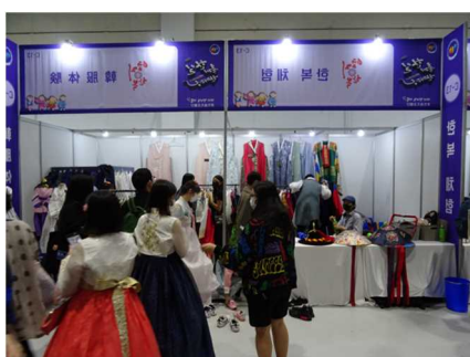
写真5：試着を楽しむ様子

今年は3年ぶりのオフラインでの開催ということで、日本に関心をもつ若者をはじめ、多くの来場者で会場は熱気に包まれながらフィナーレを迎えました（写真8）。ブース出展した日本の自治体担当者からも「観光だけでなく、物産についても来場された方々に知っていただく良い機会となった」「日本との交流に対する期待感の高まりを感じた」などの感想が寄せられました。