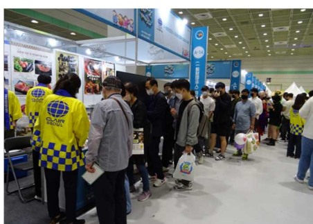
写真7：クレアソウル事務局の様子