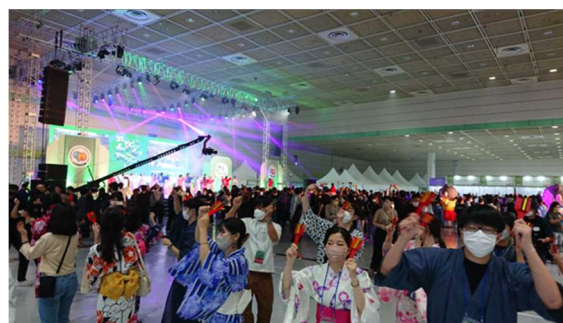
写真8：フィナーレの様子