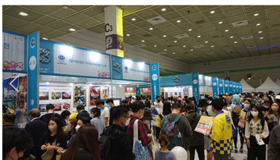
写真6：自治体ブースに集まる来場者