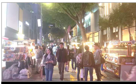
写真1：外国人観光客で賑わう様子

先日、平日に明洞を歩いた際は、ビザ取得が免除されるまではあまり見られなかった日本人などの海外からの観光客の姿もたくさん見かけるなど、この数か月で街の雰囲気が変わったと感じております。また最近では、ソウル世界花火大会が3年ぶりに開催されるなど、韓国では新型コロナウイルス流行前のような日常が再開しております（写真1、2）。