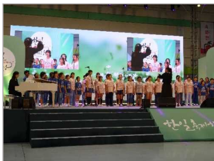
写真3：オープニングの様子

第18回目となる今年のソウルでの開催は「また、会える喜び」をテーマに、2022年9月25日（日）にソウル特別市江南区のCOEXで開催されました。当日は、午前11時よりオープニング公演として、ソウル市少年少女合唱団とソウル日本人学校合唱団の子どもたちによる「日韓少年少女合唱団」の公演からスタートし、来賓紹介をはじめ開会宣言、祝辞が行われました。午後からは、津軽三味線公演や百済味摩之タルチュム（仮面踊り）のほか、伝統舞踊やK-POP、J-POPなどの公演が続き、ステージを彩りました（写真3、4）。