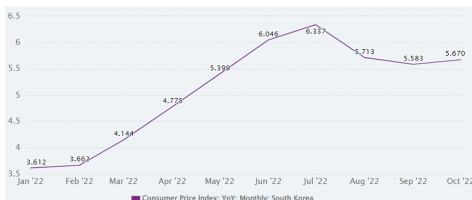
表1：韓国の消費者物価上昇率の推移

政策金利については、1月に新型コロナウイルス流行前の1.25%に引き上げて以降、最近の物価上昇に対応するため、韓国銀行の金融通貨委員会にて立て続けに利上げが行われており、10月には3%になるなど、2012年10月以来、10年ぶりの高水準になっております(表2)。