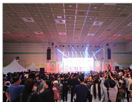
写真4：出演者によるパフォーマンスの様子