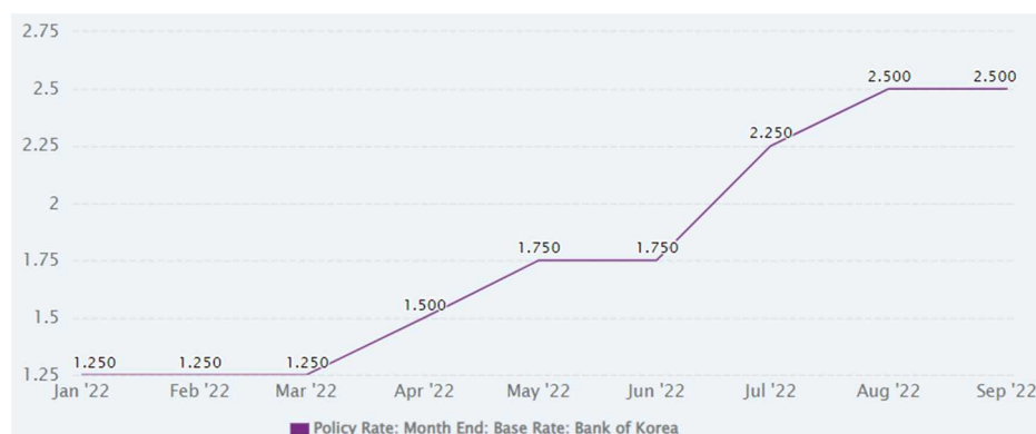
表2：韓国の政策金利の推移

政策金利については、1月に新型コロナウイルス流行前の1.25%に引き上げて以降、最近の物価上昇に対応するため、韓国銀行の金融通貨委員会にて立て続けに利上げが行われており、10月には3%になるなど、2012年10月以来、10年ぶりの高水準になっております(表2)。