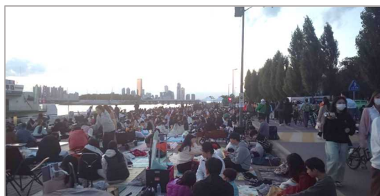
写真2：花火大会の場所取りの様子