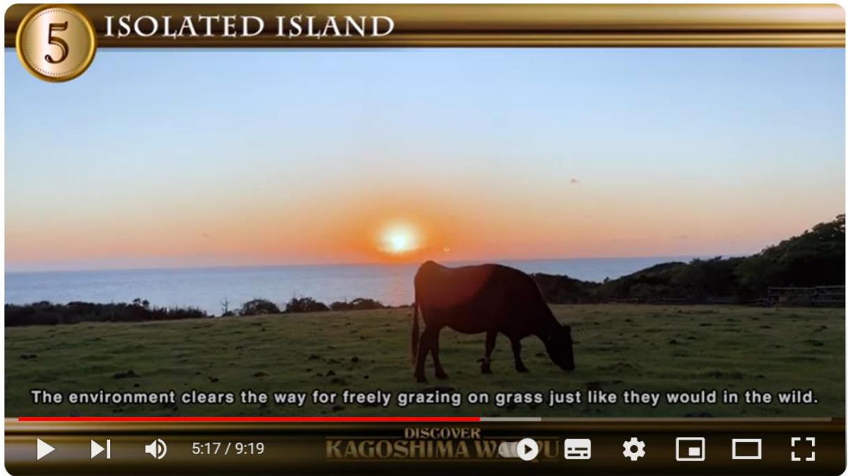
DISCOVER “KAGOSHIMA WAGYU” (English version)