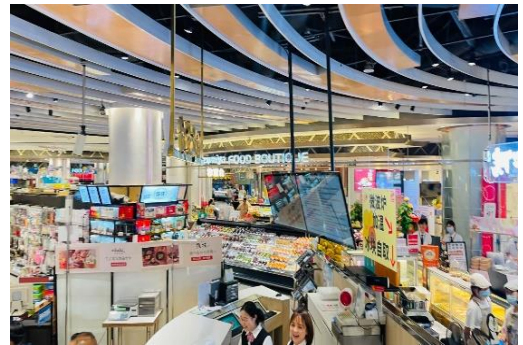
【地下の食品スーパーの様子】

その後、同スーパーの責任者（日本人総経理）にご挨拶したところ、自治体と連携したイベント等に取り組みたいとお考えがあり、過去にも他県のフェアやテストマーケティング等を実施された経験があるとのことでした。また、この方はイズミヤ時代、肉や魚のバイヤーとして鹿児島を数回訪問されたことがあり、食材を始め良い産品があるという印象を持っていただけていました。