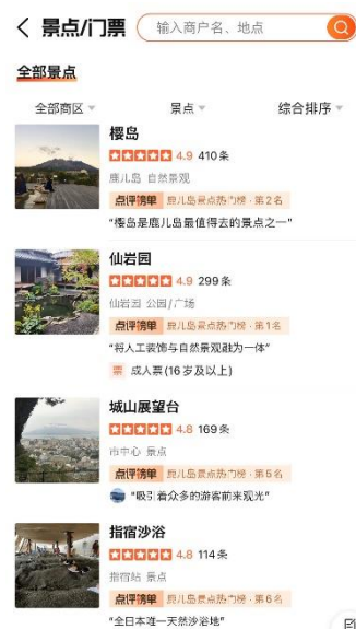
【大衆点評の画面の一部】

鹿児島の情報を検索してみたところ、飲食店や各種ショップ、観光施設など、既に複数のお店や事業所等が掲載されていました。今後、中国からのインバウンドが本格的に回復していけば、同サイトやアプリの利用者もより増加していくことが予想されます。日本版公式HPには登録や運用方法、導入事例など、詳しく掲載されています。中国からのインバウンド、特に個人旅行客の集客に興味がある方は、活用を検討されてみるのも良いかと思います。