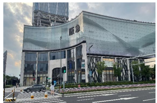
【寧波阪急百貨店の外観】

寧波市は日本ではあまり知られていませんが、実は多くの富裕層が暮らす中国有数の経済都市で、今後の経済発展ポテンシャルが高い都市として知られています。このような背景もあり、2021年4月に阪急百貨店の中国一号店として、「寧波阪急百貨店」がオープンしています。寧波市の一等地に建設された同店は、大阪の阪急本店を上回る売場面積を誇り、超高級ブランドや日本関連のテナントを取り揃え、富裕層の取込みを図っています。