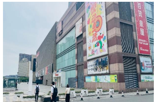
【蘇州泉屋百貨の外観】

2011年、そのイズミヤの中国一号店として、上海市の隣の蘇州市に「蘇州泉屋百貨」がオープンしました。地下1階には核店舗となる直営の食品スーパーがあり、4階までのフロアにユニクロなど日系ブランドを始めとする各種テナントが入居しています。