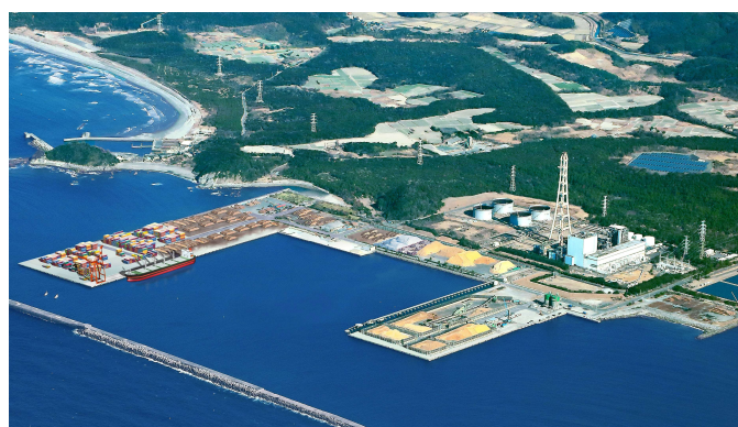
完成イメージパース図

令和3年に国直轄事業化が決定された「川内港唐浜埠頭国際物流ターミナル整備事業」が国・県により、進められており、令和8年4月に暫定供用を予定。令和9年度秋には、ガントリークレーンの稼働も予定されています。