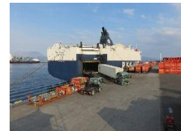
【鹿児島港国際コンテナヤードでの荷役風景】